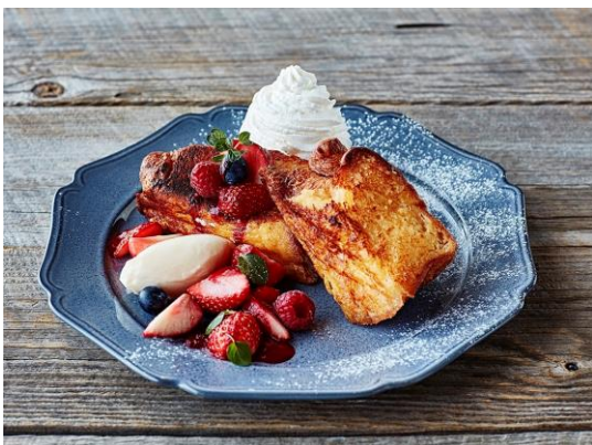
（左）イメージ：通常サイズのフレンチトースト

※同一グループ・同一テーブル 4 名様以内でのご案内となります。小さなお子様（乳幼児）や介助が必要なお客様が一緒の場合は、ご予約時に必ずお申し出ください。